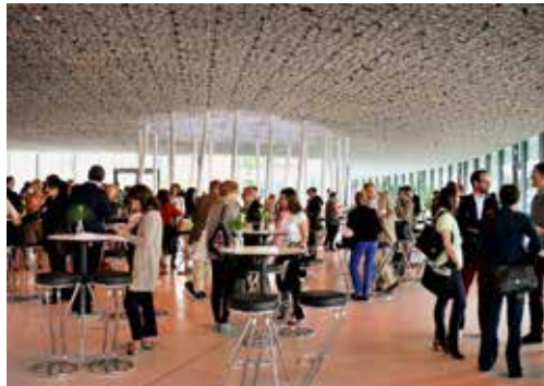
Der SwissFundraisingDay: Treffpunkt der Schweizer FundraiserInnen.

Die Themen der sechs Workshops am Morgen sind Stiftungsfundraising, Unternehmenskooperationen, Spenderbefragungen, aktuelle Trends im Fundraising, Grossspen-