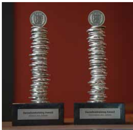
Die Swissfundraising-Award-Trophäen «Franca».

Zum dritten Mal wird der Swissfundraising-Award im Anschluss an den SwissFundraisingDay verliehen. Dieses Mal ist es kein Geheimnis mehr: Die beiden Gewinner der «Aktion des Jahres» und der «Innovation des Jahres» erhalten unsere Trophäe «Franca». Verliehen wird der Award in den zwei Kategorien «Fundraising-Aktion» und «Fundraising-Innovation» – hier werden Bestleistungen ausgezeichnet. Einzelpersonen, NPO und Agenturen können bis zum 31. März 2016 mögliche preiswürdige Aktionen und Innovationen einreichen unter www.swissfundraising.org/award .