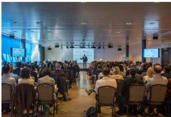
Der Treffpunkt für Schweizer Fundraiserinnen und Fundraiser.