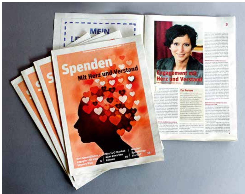
Die gemeinsame Spendenbeilage von Zewo und Swissfundraising erscheint 2015 bereits zum achten Mal.

Die seit Jahren bewährte Beilage beschäftigt sich dieses Jahr mit dem Thema «Mit Spenden Zeichen setzen». Am Sonntag, 22. November 2015, wird das Spendenmagazin in der NZZ am Sonntag und in der SonntagsZeitung erscheinen. Die Spendenbeilage gibt Zewo-zertifizierten NPO die Möglichkeit, in Inseraten ihre Organisation vorzustellen, ihre Anliegen zu präsentieren und auf aktuelle Projekte aufmerksam zu machen.