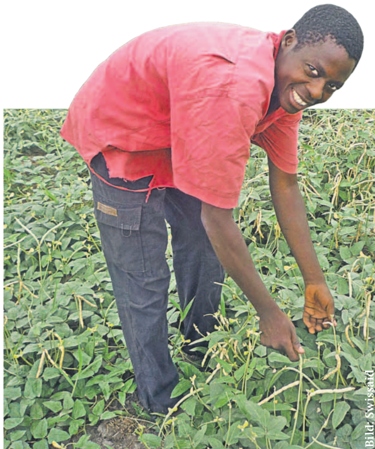
Nachhaltige Veränderung braucht Zeit.

Im Jahr 2004 startete Helvetas zusammen mit ihren lokalen Partnern in Kirgisien ein Programm von biologisch produzierter Fairtrade-Baumwolle. Beteiligt sind zu Beginn 58 Bauern an dem Programm, waren es Ende 2009 bereits 765, davon ein Viertel Frauen, die in 71 Bauerngruppen organisiert sind. Eine von der Universität Bern durchgeführte Feldstudie untersuchte die Auswirkungen des Produktionsprogramms auf die sozioökonomischen Bedingungen der Bauern und ihre Felder. Die Studie zeigt, dass die Produk-