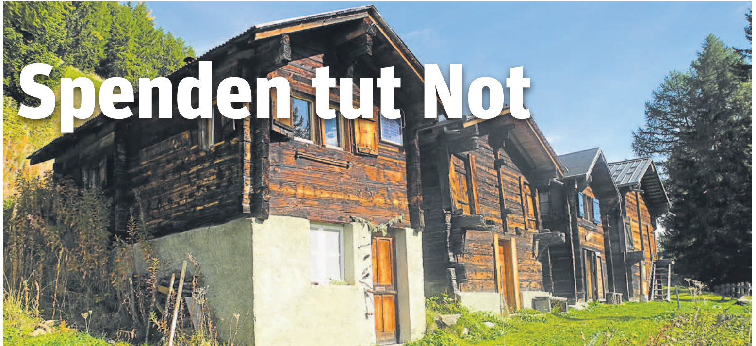
Der Alpenraum bedarf eines besonderen Schutzes.

Die zahlreichen Hilfswerke in der Schweiz sind Ausdruck des grossen Engagements der hier lebenden Menschen und einer lebendigen Zivilgesellschaft. Ihre Arbeit ist aus unterschiedlichen Gründen nötig.