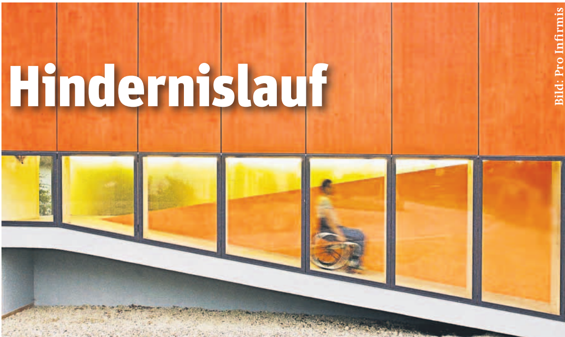
Rampen ermöglichen einen hindernisfreien Zugang für Menschen mit Behinderung.

In der Schweiz beziehen rund 450 000 Personen Leistungen der Invalidenversicherung. Im Jahr 2004 trat das Behinderten-Gleichstellungsgesetz in Kraft. Es markierte einen wichtigen Fort-