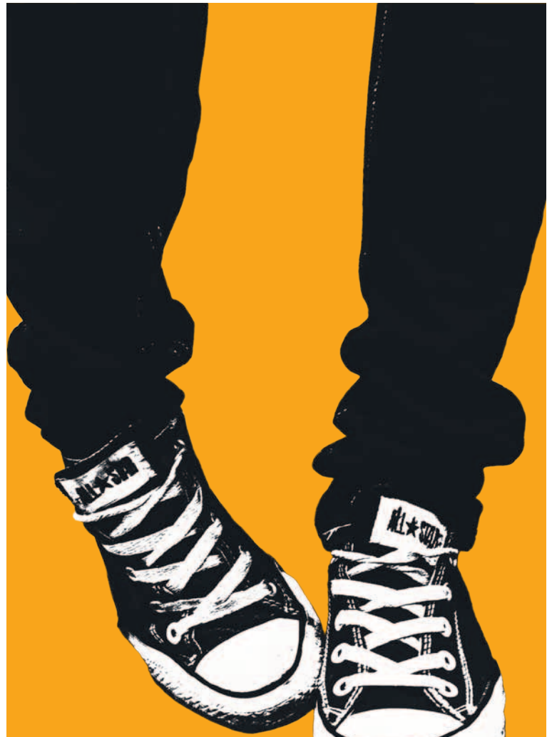
Ohne Arbeit hat man einen schweren Stand.