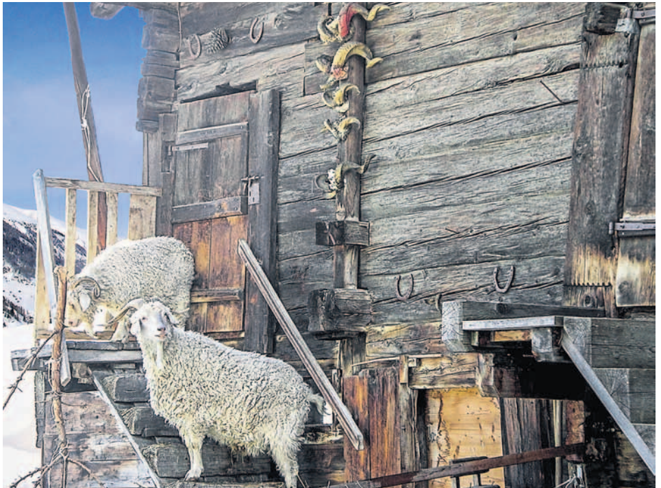
Intakte Bergwelten für Mensch, Tier und Natur erhalten.

Über ein Anliegen herrscht unter vielen Bewohnerinnen und Bewohnern der Alpenstaaten Einigkeit: Der Alpenraum muss geschützt werden. Doch er soll auch genutzt werden. Die Frage ist nur wie.