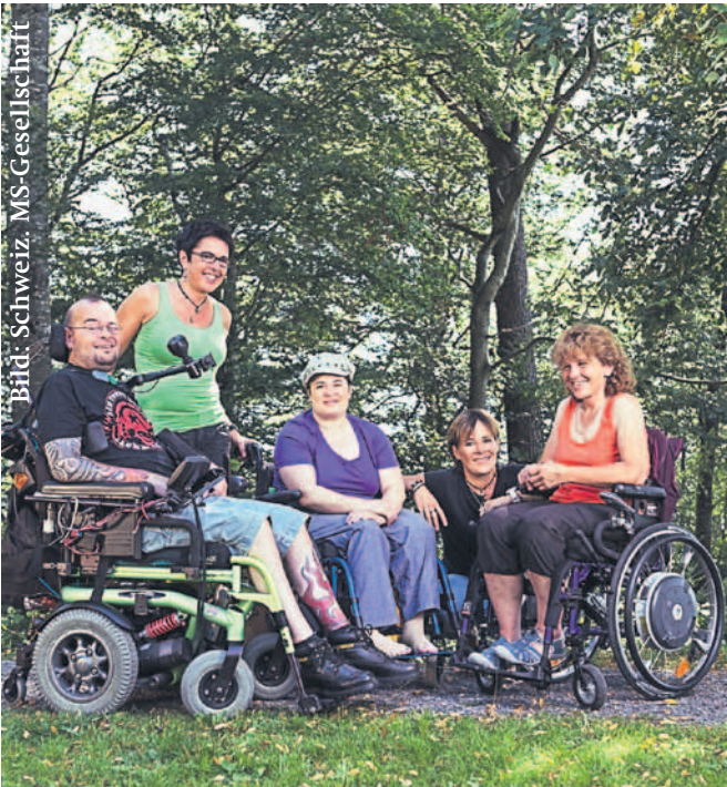
Lebensfreude uns Zuversicht