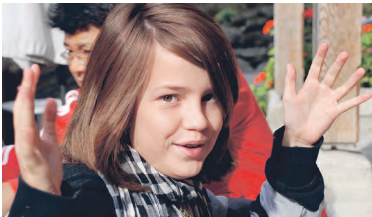
Gehörlose Kinder mit Zukunft – dank optimaler Förderung

Noch bis vor wenigen Jahrzehnten wurden in der Schweiz und weltweit Gehörlose stigmatisiert. Bildung und Beruf blieben ihnen meistens verwehrt. Ihre natürlichste Form der Verständigung – die Gebärdensprache – wurde gemeinhin als primitiv empfunden und zum Teil sogar mit Zwang unterbunden. Zum Glück haben sich die Zeiten geändert: Gehörlose und Hörbehinderte leben unter uns, mit uns, und viele von ihnen